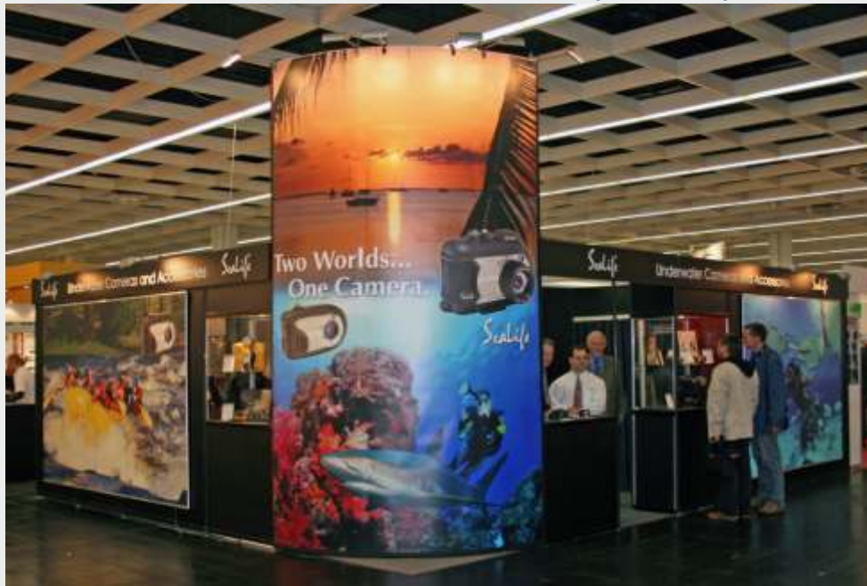
Visit us at our webside www.messestaende-mietweise.de