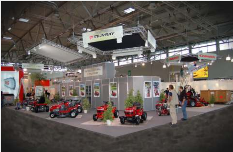
Pörschmann & Partner Messebau GmbH Freimersdorferweg Haus Daveg 50859 Köln