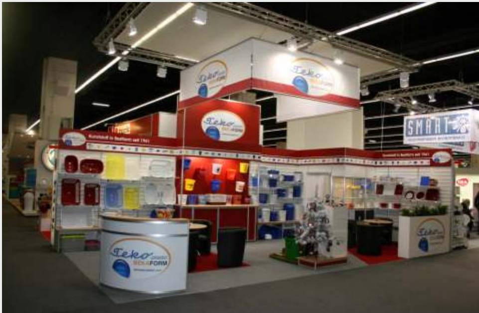
Pörschmann & Partner Messebau GmbH Freimersdorferweg Haus Daveg 50859 Köln