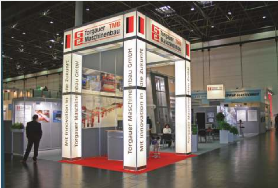
Visit us at our webside www.messestaende-mietweise.de